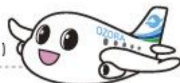
大空町吉祥物 So Lucky